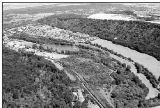
Parmi les dix espaces naturels sensibles du département, le vallon de Bellefontaine à Champigneulle.

■ Environnement . Près de 5M€ pour le secteur de l'assainissement, le budget alloué à l'environnement se traduit aussi par une enveloppe non négligeable pour la préservation des espaces naturels sensibles: près de 2M€.